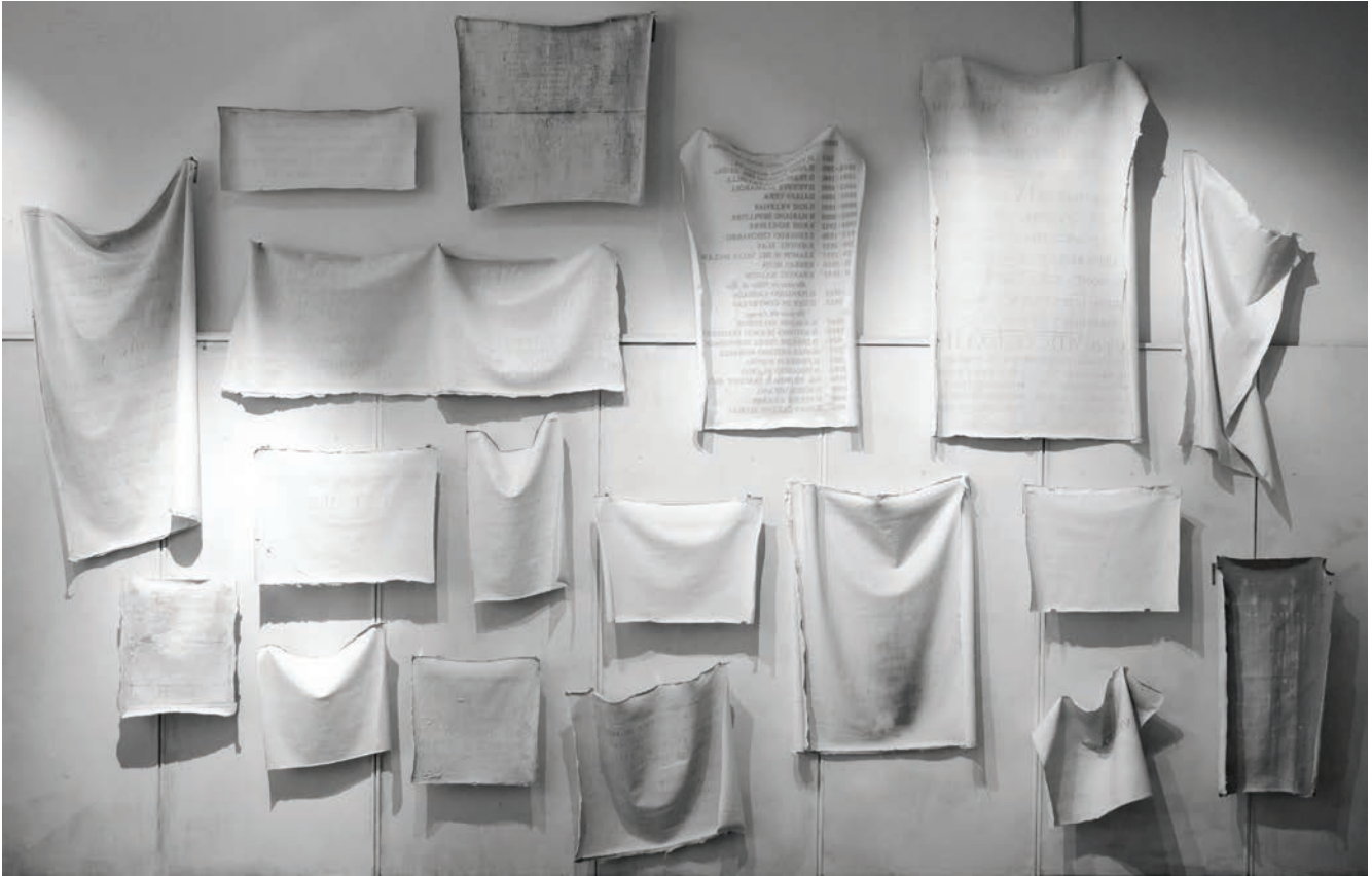
Vista de la instalación