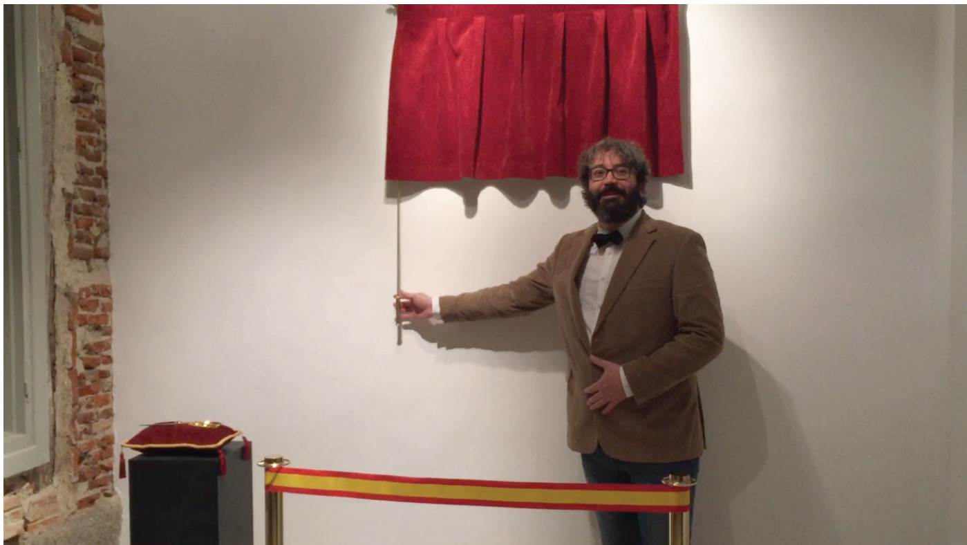
Inauguración Vistas de la instalación