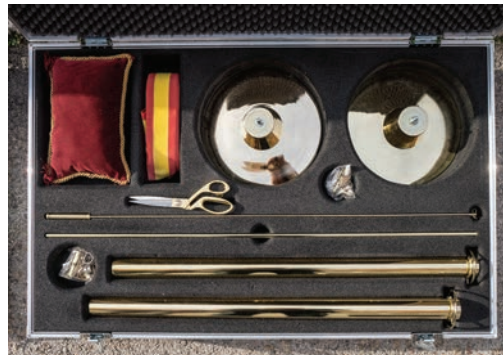
Lorem Ipsum – Kit de Inauguración Exprés